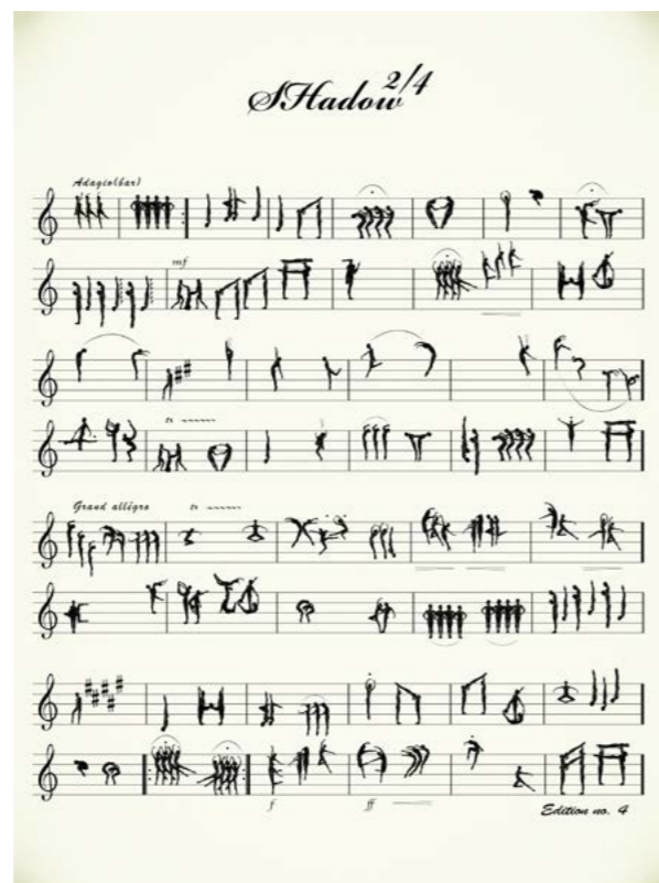
© BAKiShadow 2-4 courtesy OPIOM Gallery