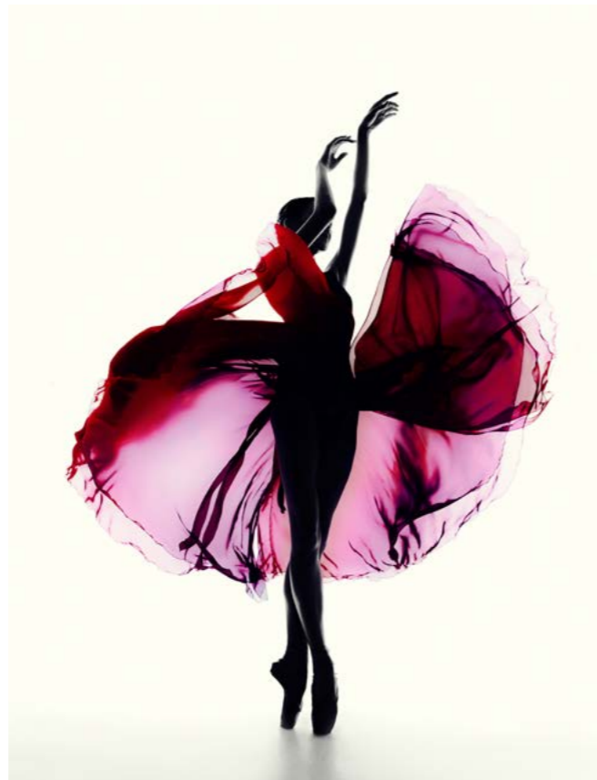
© BAKi, Shadow 1-1 (06) courtesy OPIOM Gallery