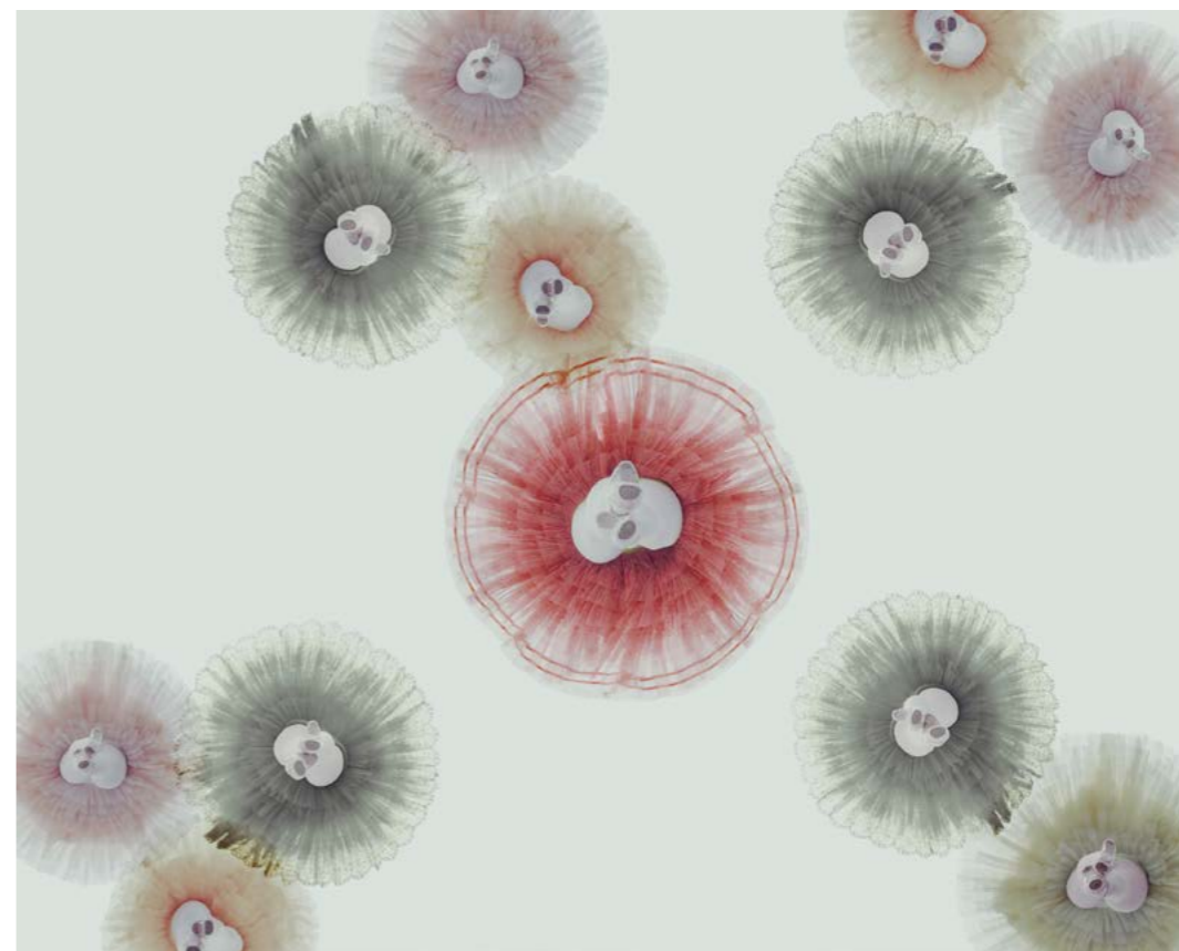
© BAKi, Vision (Under) 2, 2016, courtesy OPIOM Gallery