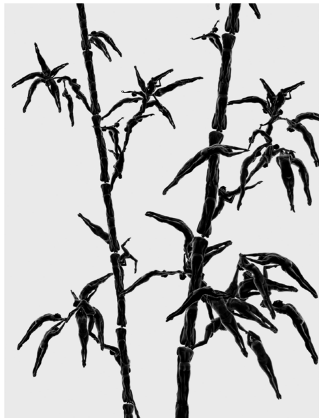
© BAKi, Shadow 2-7 (01)