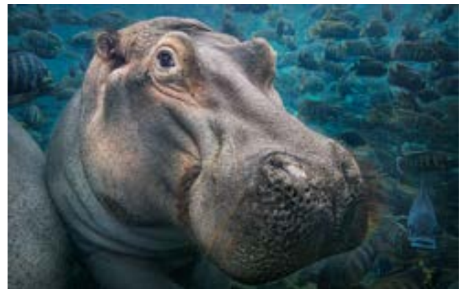
© Tim FLACH, Hippo Underwater, by Courtesy of OPIOM Gallery