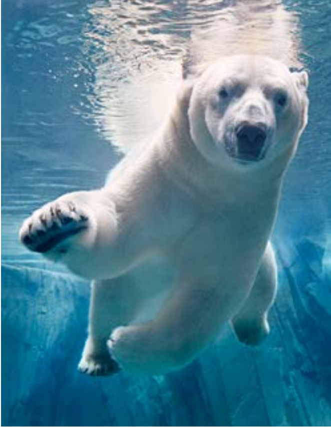
© Tim FLACH, Polar Bear Swimming, by Courtesy of OPIOM Gallery