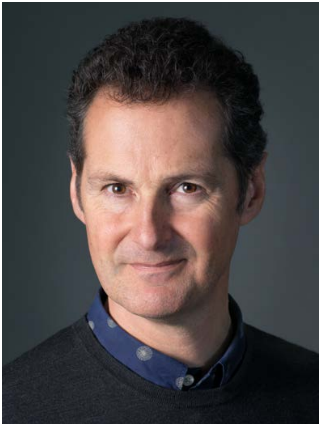
© Portrait de Tim Flach, by Courtesy of OPIOM Gallery