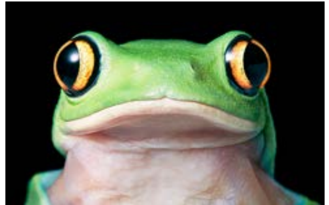
© Tim FLACH, Yellow Eye Tree Frog, by Courtesy of OPIOM Gallery