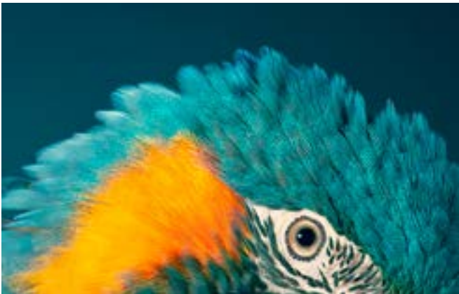
© Tim FLACH, Blue Throated Macaw, by Courtesy of OPIOM Gallery