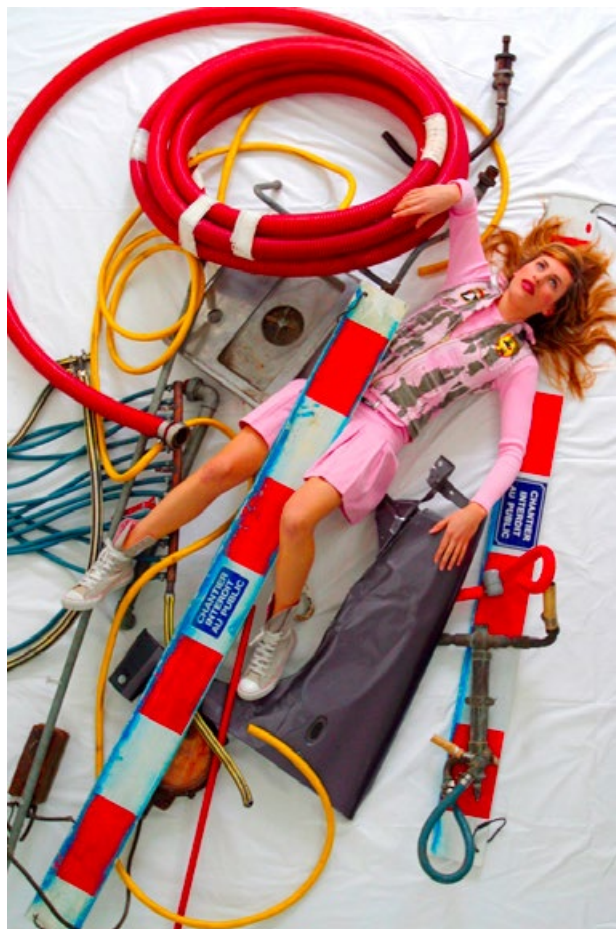
© Peter KLASSEN, Tsunami #1 / SK, 2006