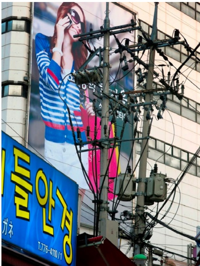
© Peter KLASSEN, Electrified Girl, Seoul, 2016